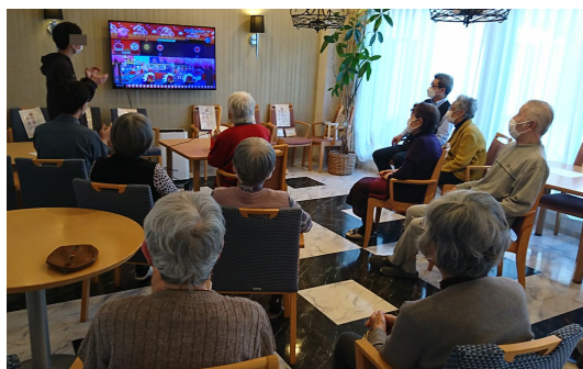
※バンダイナムコ様の許可を得て開催しております。